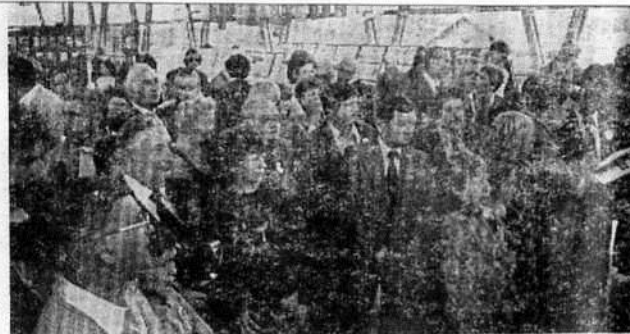
Le public pendant les cérémonies